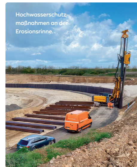
Hochwasserschutzmaßnahmen an der Erosionsrinne.

RWE Power hat die Bauarbeiten an der Erosionsrinne hinter Lamersdorf weitestgehend fertiggestellt. Sie verbessern den Hochwasserschutz von Lamersdorf deutlich, teilte das Unternehmen Indens Bürgermeister Stefan Pfenning mit. Ziel der Bauarbeiten ist es, für den Fall eines erneuten Jahrtausendhochwassers des Flusses Inde eine weiter rückschreitende Erosion im Bereich Lamersdorf zu verhindern. Dazu wurden zunächst die Böschungsflanken der am 15. Juli 2021 entstandenen Erosionsrinne abgeflacht. Zum Schutz der Bebauung in der weiteren Umgebung wurde eine Spundwand aus Stahl 15 Meter tief in den Boden gerammt. Außerdem wurde die Form der Rinne umgestaltet und gesichert. Die nördliche Böschung bekam eine zusätzliche, zweite Spundwand. —