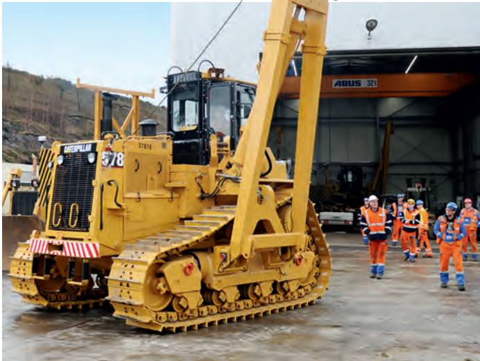
↑ RWE-MITARBEITER haben die 18 Jahre alte Raupe in Einzelteile zerlegt, diese gereinigt, repariert und wieder zusammengepuszelt.

Inden. Im Tagebau krabbeln viele Raupen, aber 18 von ihnen haben bei RWE Power einen Spezialauftrag: Meter für Meter verrücken sie die tonnenschweren Förderbänder, die Braunkohle und Abraum von den Baggern wegtransportieren. Eine Arbeit, die auch am härtesten Stahl Spuren hinterlässt. 18 Jahre und über 16.714 Betriebsstunden hatte eine Raupe im Tagebau Inden bereits auf dem Buckel, als ein Schaden am Antriebsstrang sie schließlich lahmlegte. Es ging nichts mehr – da packte die RWE-Mitarbeiter der Ehrgeiz: In Eigenleistung machten sich unterschiedliche Gewerke und Standorte daran, die Raupe in all ihre Einzelteile zu zerlegen. Da der Hersteller Caterpillar diese Maschinen nur noch unregelmäßig baut, gilt im Tagebau die Devise: erhalten statt neu kaufen. Das Ergebnis war ein doppelter Erfolg: Eine grundinstandgesetzte Raupe und ein wertvoller Erfahrungsschatz, auf den die Mitarbeiter nun bei künftigen Instandsetzungen zurückgreifen können. —