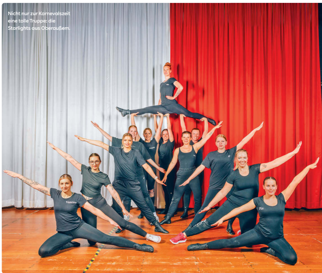
Nicht nur zur Karnevalszeit eine tolle Truppe: die Starlights aus Oberaußem.

„Sobald irgendwo ein Lied läuft, auf das unsere Choreo passt, legen wir los. Wir können gar nicht anders, als diese Schrittfolgen zu machen.“